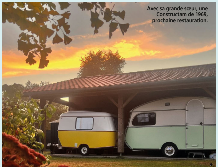
Avec sa grande sœur, une Constructam de 1969, prochaine restauration.