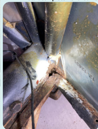
Le bas de la structure était complètement rouillé.