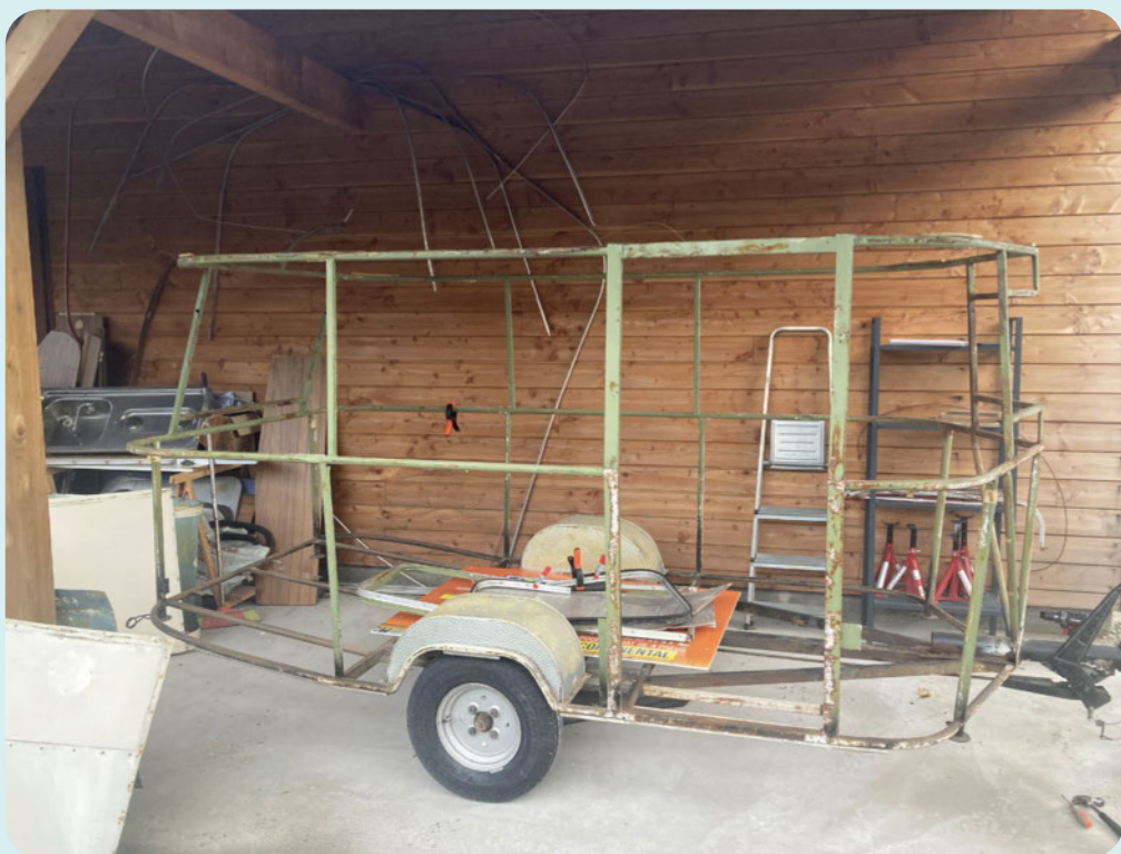
L'Eriba Puck a été ramenée à sa structure.