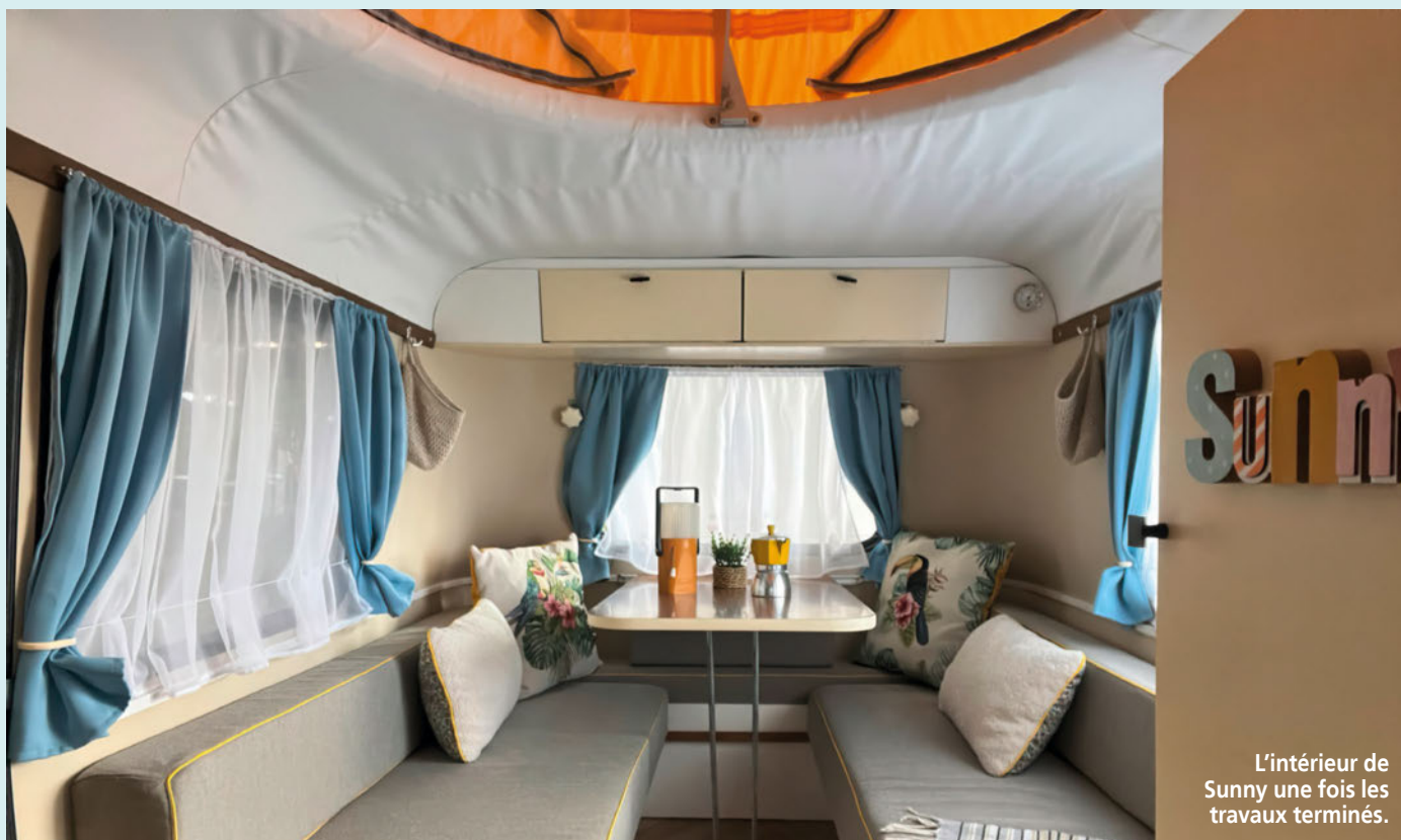
L'intérieur de Sunny une fois les travaux terminés.

caravanes bien plus vintage. » Suivent une deuxième, puis une troisième, jusqu'à atteindre le total de sept caravanes rénovées. Parmi toutes les caravanes auxquelles elle a donné un nouveau souffle, figure Sunny. Voici son histoire.