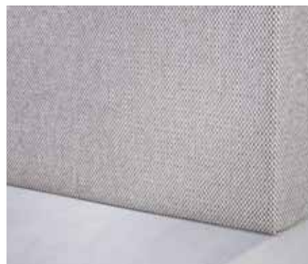
Belfast (en option)